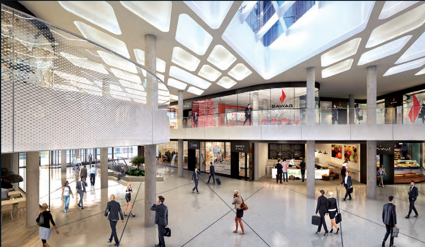
PRO PROJEKT ist am Bauvorhaben THE ICON VIENNA (oben) maßgeblich beteiligt.