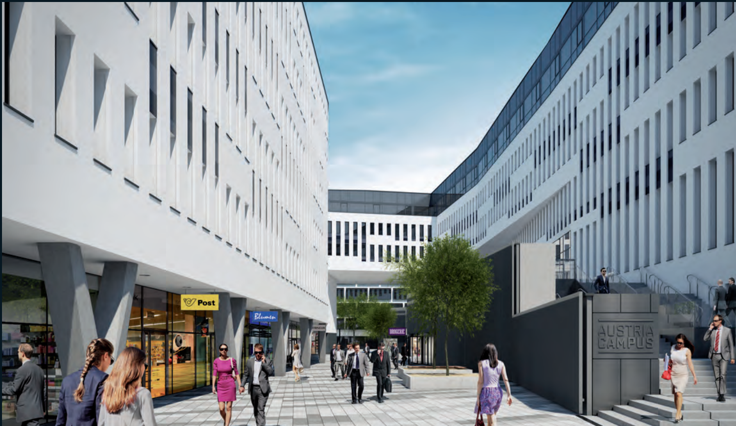
PRO PROJEKT ist am Bauvorhaben AUSTRIA CAMPUS (oben) maßgeblich beteiligt.