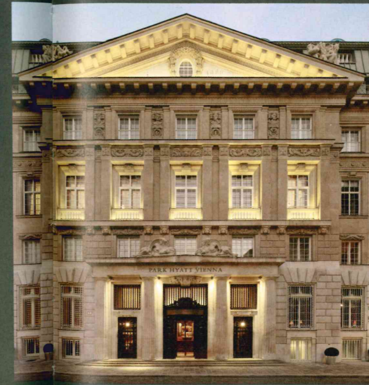
Aktuelle und bereits realisierte Top-Projekte von Pro Projekt – im Uhrzeigersinn von links oben nach links unten : AUSTRIA CAMPUS, PARKHOTEL und PARKAPARTMENTS AM BELVEDERE, Business Center THE ICON VIENNA, Hotel PARK HYATT VIENNA, GOLDENES QUARTIER, Office Center RIVERGATE